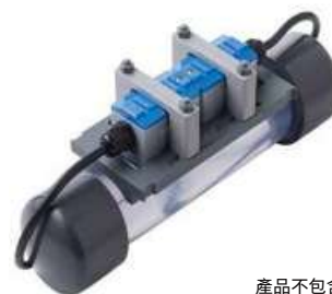
產品不包含透明管