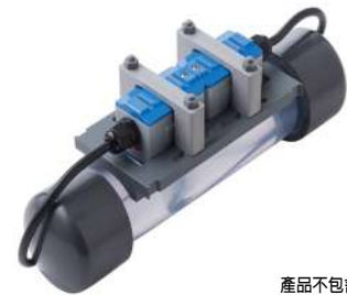
產品不包含透明管